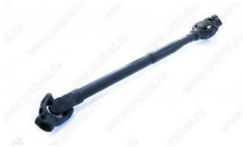
- 5557Я2-3402109-30 Втулка шлицевая с шарниром в сборе (ЯМЗ-238). Цена – 4525руб.