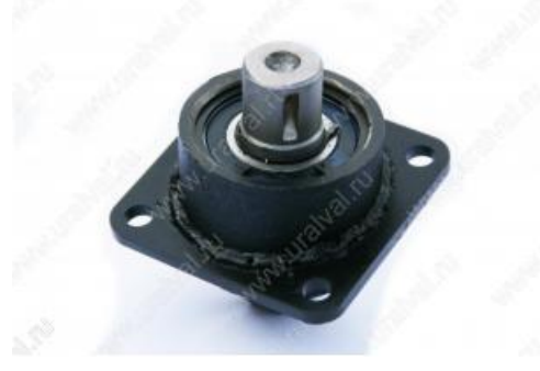
- 5557Я-3403103 Опора промежуточная в сборе. Цена – 1830руб.