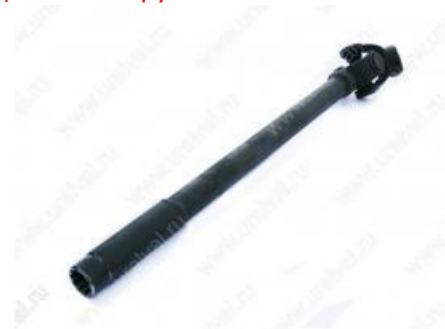
- 4320Ф-3402109 Втулка шлицевая с шарниром (под "Борисовский" рулевой механизм). Цена – 2850руб.