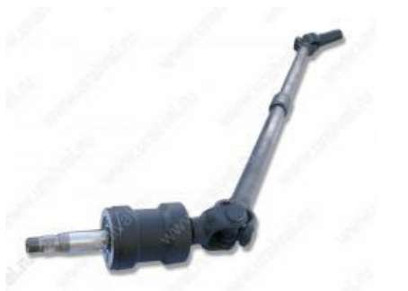
- 4320-3402090 Комплект карданов рулевого управления на а/м с двигателем КамАЗ-740. Цена – 7000руб.