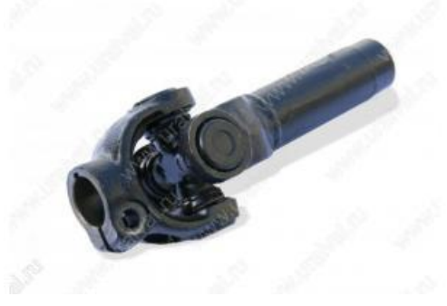
- 4320П2-3402074 Вилка скользящая с шарниром. Цена – 3150руб.