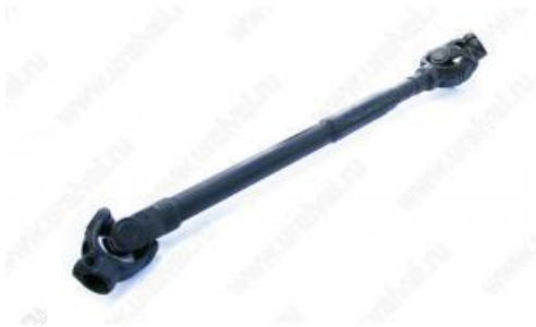
- 5557Я-3402109-30 Втулка шлицевая с шарниром в сборе (ЯМЗ-236). Цена – 4525руб.