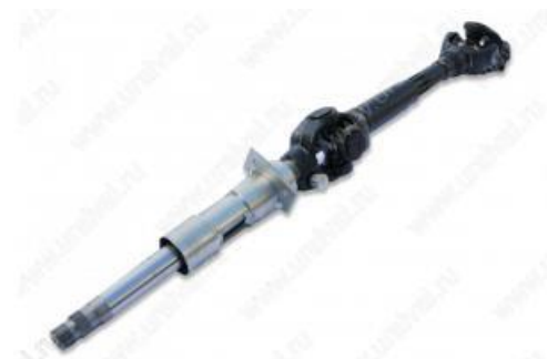
- 6370-3400020 Комплект рулевого управления без капотной серии 6370. Цена – 12000руб.