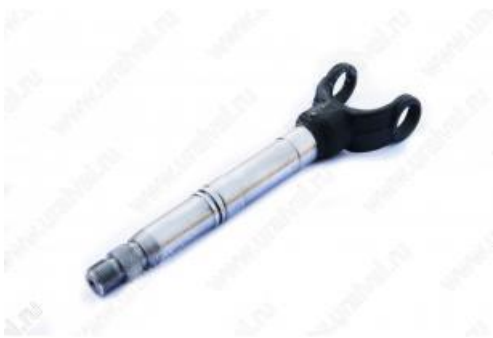
- 5557-3402042-10 Вал рулевого управления. Цена – 1630руб.