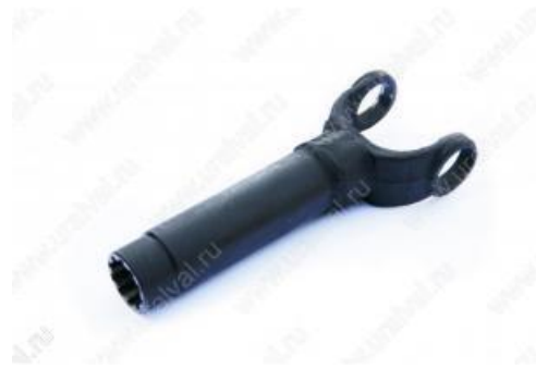
- 5557Я-3402048-10 Вилка скользящая Цена – 1780руб.