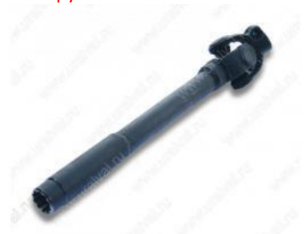
- 5557Я2-3402109 Втулка шлицевая с шарниром (ЯМЗ 238). Цена – 2550руб.