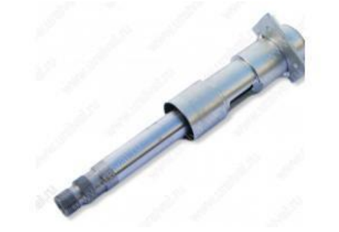
- 4320Ф-3402240 Колонка рулевого управления. Цена – 4680руб.