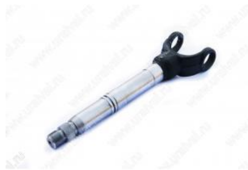
- 4320-3402042 Вал колеса. Цена – 1580руб.