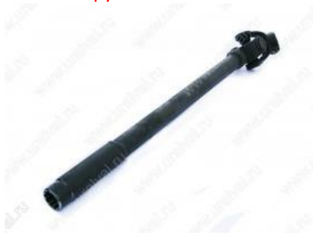
- 4320Ф-3402109-30 Втулка шлицевая с шарниром (под «Борисовский» рулевой механизм). Цена – 2800руб.