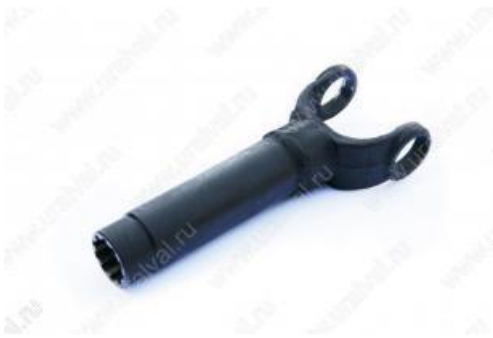
- 4320-3402048-10 Вилка скользящая Цена – 1580руб.