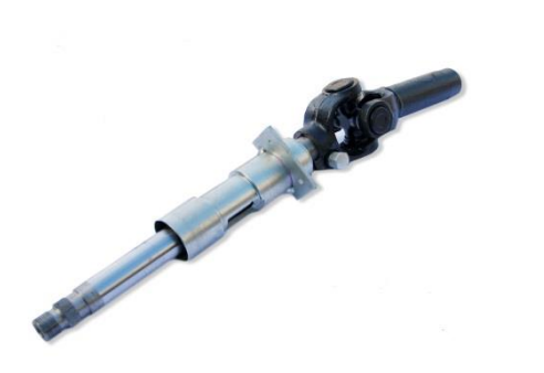
- 6563Х-3402240 Колонка рулевого управления Урал 63685. Цена – 11300руб.