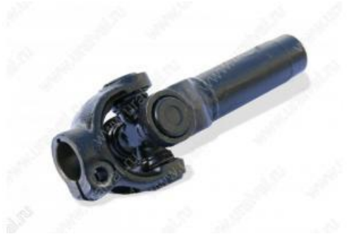
- 4320П2-3402074 Вилка скользящая с шарниром.