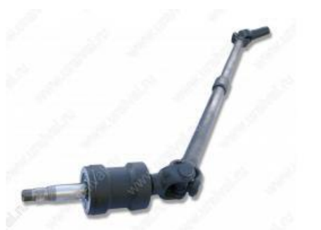
- 4320-3402090 Комплект карданов рулевого управления на а/м с двигателем КамАЗ-740. Цена – 6000 руб.