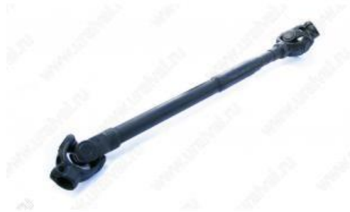
- 5557Я2-3402109-30 Втулка шлицевая с шарниром в сборе (ЯМЗ-238). Цена – 3850 руб.