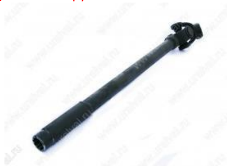
- 4320Ф-3402109-30 Втулка шлицевая с шарниром (под «Борисовский» рулевой механизм). Цена – 2100 руб.