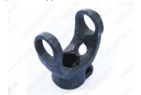
- 4322-3402117-10 Вилка карданного шарнира.