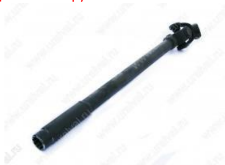
- 5557Я2-3402109 Втулка шлицевая с шарниром (ЯМЗ-238). Цена – 1950 руб.