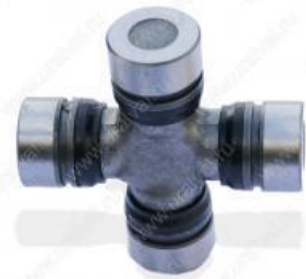
- 412-2201025 Крестовина рулевого управления УРАЛ двигателем ЯМЗ. Цена – 210 руб.