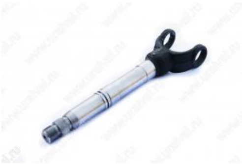
- 5557-3402042-10 Вал рулевого управления.