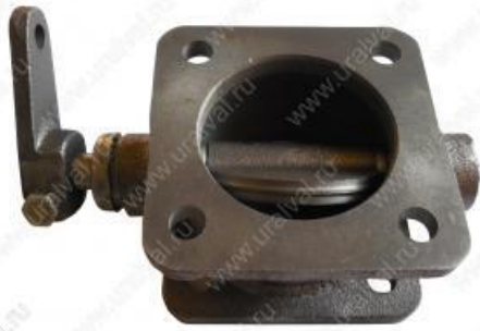
- 4320Я-3570010 Тормоз вспомогательный (двигатель ЯМЗ-236, 238М2). Цена – 2900 руб.