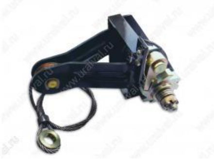
- 4310 Лебедка подъема запасного колеса с тросом 2,5 м Камаз 4310. Цена – 6000 руб.