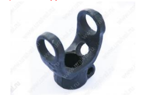
- 6363-3402117 Вилка кардана рулевого управления.