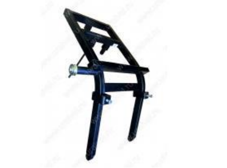
- Держатель Запасного колеса Камаз 4310. Цена – 8000 руб.