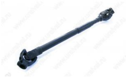
- 5557Я-3402109-30 Втулка шлицевая шарниром в сборе (ЯМЗ-236). Цена – 3850 руб.