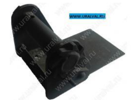
- Лебедка подъема запасного колеса Германия. Цена – 8000 руб.