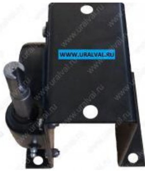
- 090.016.00.ЕС Лебедка подъема запасного колеса (СПЕЦТЕХНИКА). Цена – 5000 руб.