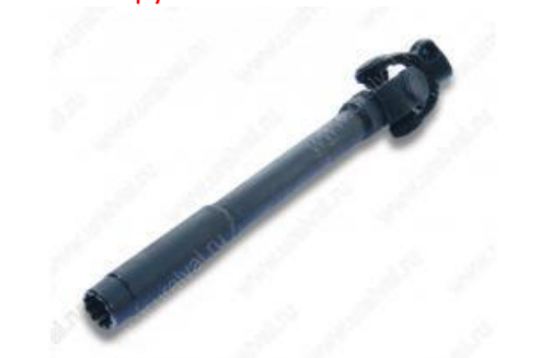
- 5557Я-3402109 Втулка шлицевая с шарниром ЯМЗ (236). Цена – 1950 руб.