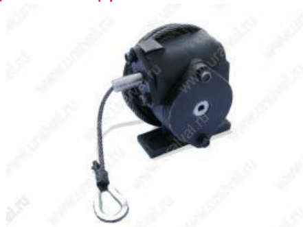
- 4320-3105838 Редуктор подъема запасного колеса (Лебедка ДЗК). Цена – 6000 руб.