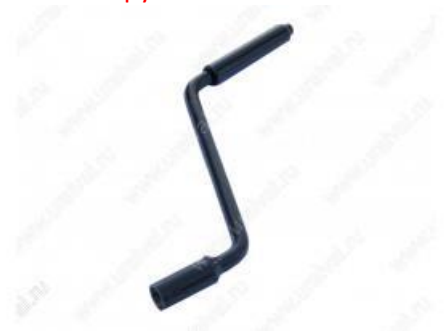
- 4320-3105862 Рукоятка лебедки. Цена – 300 руб.