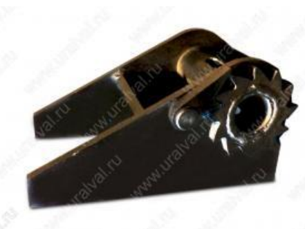
- Лебедка лесовоз, сортиментовоз (Камаз, Урал, IVECO) трос 3.5м. Цена – 4000 руб.