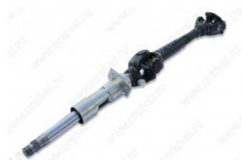
- 6370-3400020 Комплект рулевого управления бескапотной серии 6370. Цена – 14800 руб.