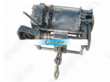
- 375-4511010 Лебёдка с тросоукладчиком в сборе (375-4501005) АЗ "УРАЛ" Цена – 95000 руб.