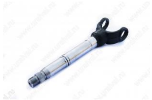
- 4320-3402042 Вал колеса.